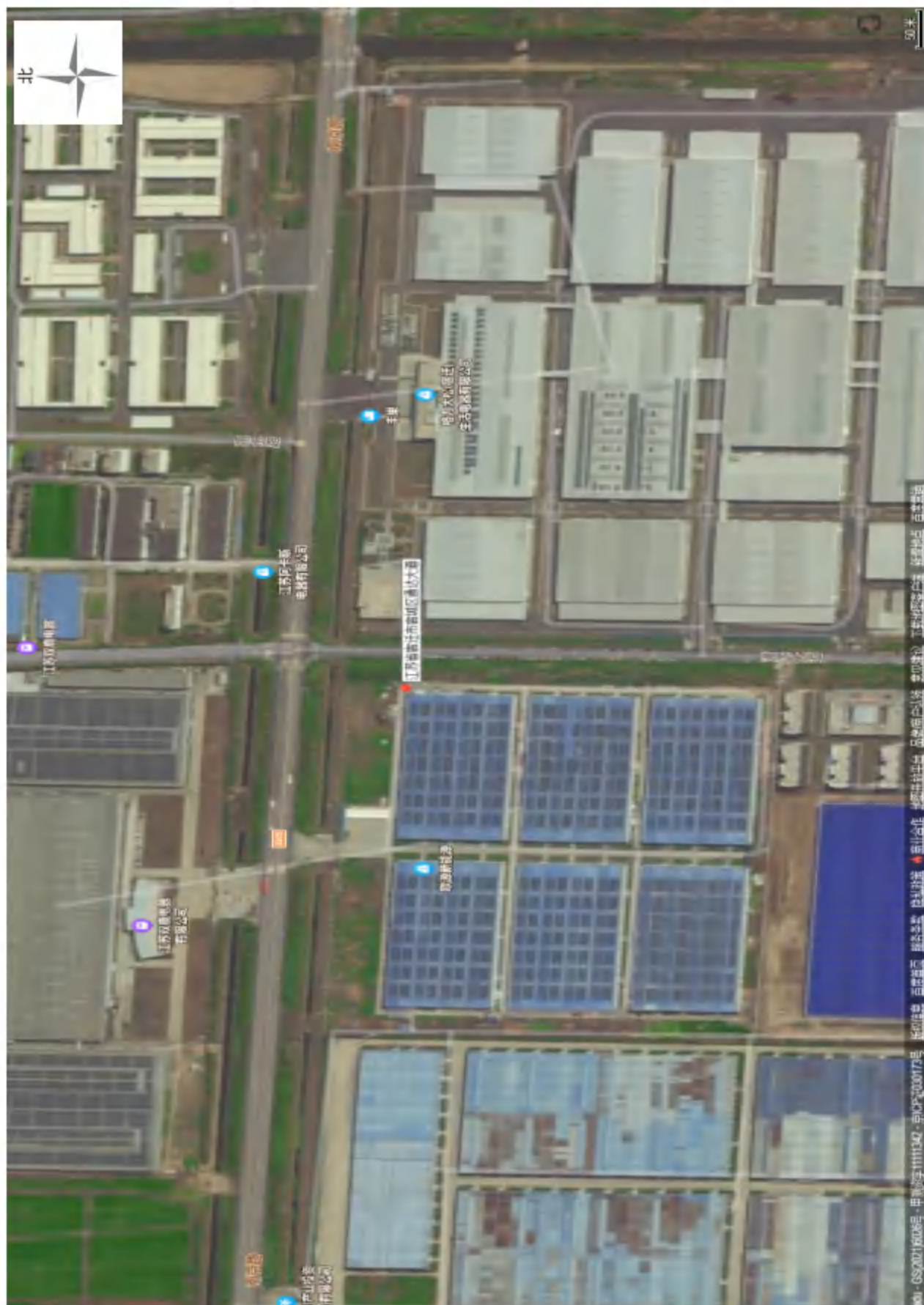
图 3-2 周边概况图