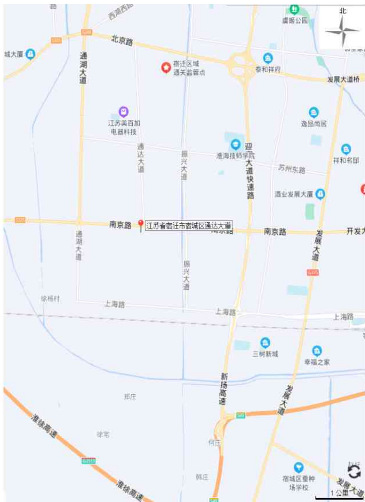
图 3-1 项目所在地地理位置图